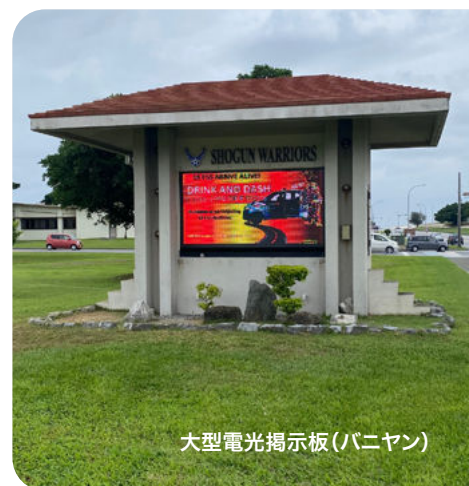
大型電光掲示板(バニヤン)