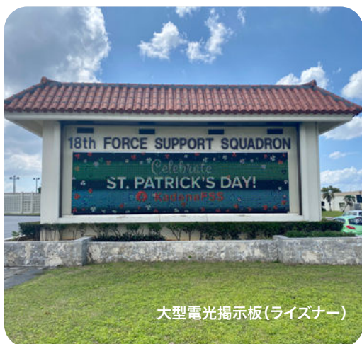
大型電光掲示板(ライズナー)