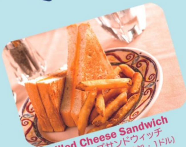
Grilled Cheese Sandwich グリルチーズサンドウィッチ $1 • Add ham (ハム追加・1ドル)