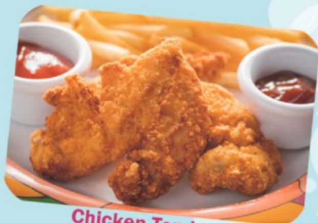
Chicken Tenders チキンテンドー