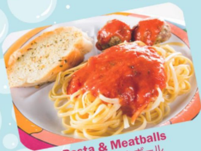
Pasta & Meatballs パスタ&ミートボール