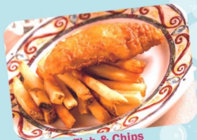
Fish & Chips フィッシュ&チップス (白身魚フライとフライドポテト)