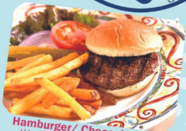
Hamburger/ Cheeseburger ハンバーガー / チーズバーガー

Served with juice, milk, or soft drink and ice cream. ジュース、ミルク、またはソフトドリンクとアイスクリーム付